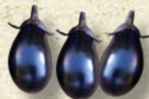
寺島ナス(蔓細千成ナス)

内藤家の菊座南瓜(きくざかぼちゃ)は新宿で名をはせ、周辺の角筈村や柏木村でも栽培されるようになり、地場野菜として定着していった。