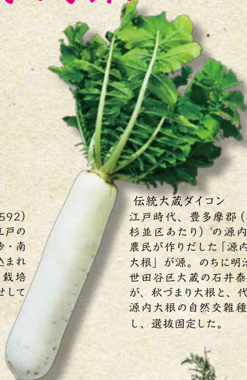
伝統大蔵ダイコン

天正年間(1573～1592)に摂津(大坂)から、江戸の砂村(現在の江東区北砂・南砂)や品川などに持ち込まれた葱。関東では葉葱の栽培が難しく、根本を土寄せて白葱が生まれたという。