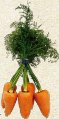
馬込三寸ニンジン

日本原産の伝統香辛料で、文政6年(1823)の『武蔵名勝図絵』の多摩・梅沢村の項に「山葵(わさび)この地の名産なり、多く作り手江戸神田へ出す」とある。