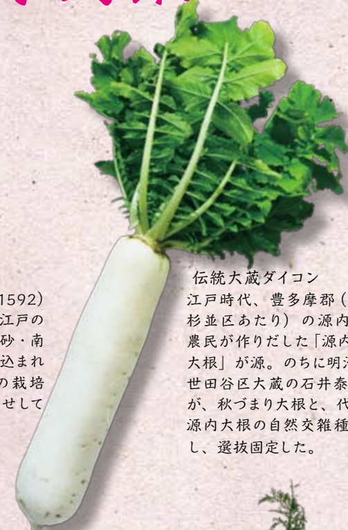
伝統大蔵ダイコン

天正年間(1573～1592)に摂津(大坂)から、江戸の砂村(現在の江東区北砂・南砂)や品川などに持ち込まれた葱。関東では葉葱の栽培が難しく、根本を土寄せて白葱が生まれたという。