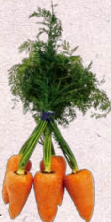
馬込三寸ニンジン

日本原産の伝統香辛料で、文政6年(1823)の『武蔵名勝図絵』の多摩・梅沢村の項に「山葵(わさび)この地の名産なり、多く作り手江戸神田へ出す」とある。