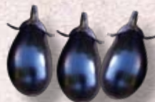
寺島ナス(蔓細千成ナス)

内藤家の菊座南瓜(きくざかぼちゃ)は新宿で名をはせ、周辺の角筈村や柏木村でも栽培されるようになり、地場野菜として定着していった。